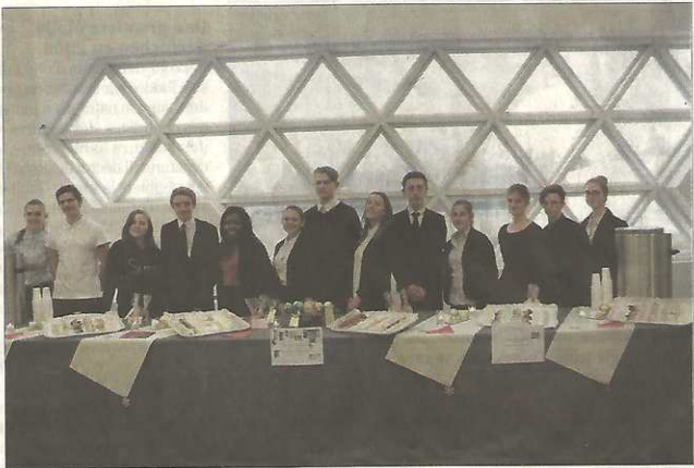
■ Les élèves présentent les petits fours confectionnés pour l'occasion.

Bienvenue au marché de Noël, instauré afin de mettre en exergue la jeune filière allemande, ouverte en 2014. Trois classes proposent désormais cette section euroallemande en bac profes-