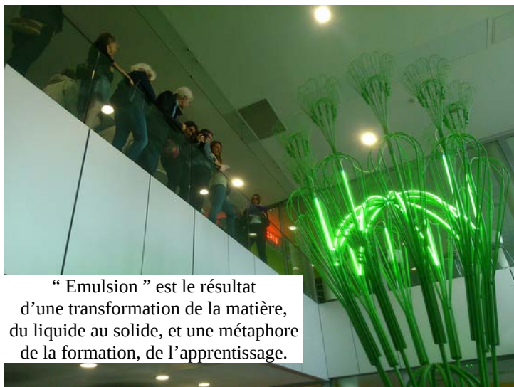
“ Emulsion ” est le résultat d'une transformation de la matière, du liquide au solide, et une métaphore de la formation, de l'apprentissage.

« Emulsion », de la designer Matali Crasset.