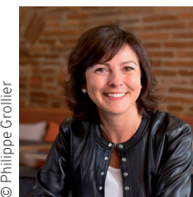
Carole Delga Présidente de la Région Occitanie / Pyrénées-Méditerranée

“ Le coût de la scolarité ne doit pas être un frein pour réussir ses études, alors la Région améliore le pouvoir d'achat des familles avec la Carte Jeune : livres gratuits, 1 er équipement “pro” gratuit, ordinateur portable... La Carte Jeune c'est l'atout gagnant. ”